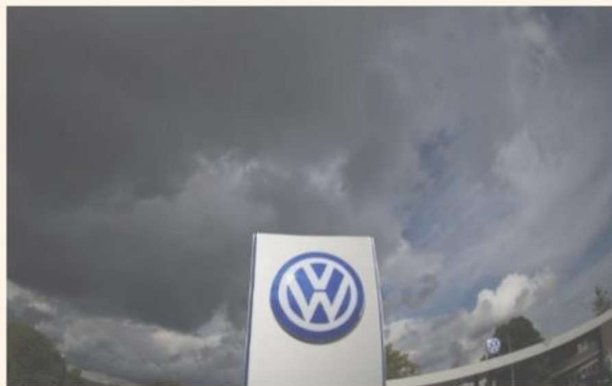
Logo de Volkswagen en su sede de Wolfsburgo.